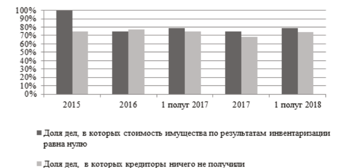
Рис. 2. Динамика имущественного обеспечения требований кредиторов в рамках процедуры реализации имущества граждан [Статистический бюллетень 2018]

Издержки взаимодействия экономических агентов в рамках процедур банкротства предлагается снизить за счет активного применения ПРД как формы контрактных отно-