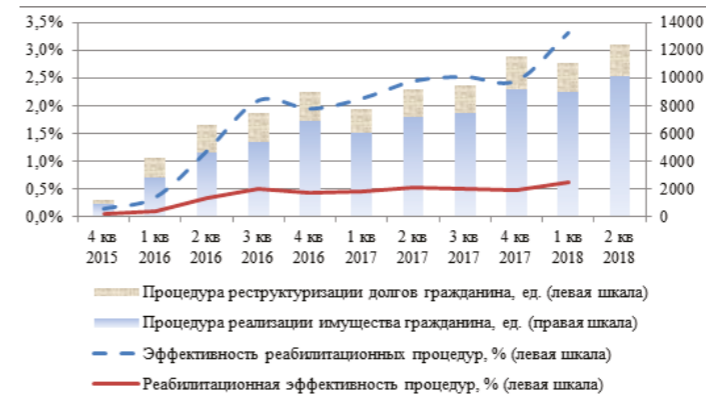
Рис. 1. Динамика и результаты процедур банкротства граждан в России [Статистический бюллетень]

онный потенциал процедур банкротства. Данная неопределенность также существует в научной сфере: в настоящее время публикации по теме экономического содержания платежеспособности граждан практически отсутствуют [Кочетков Е. П., 2017а], большая часть исследований посвящена вопросам правового регулирования неплатежеспособности граждан [Кораев К. Б., 2017].