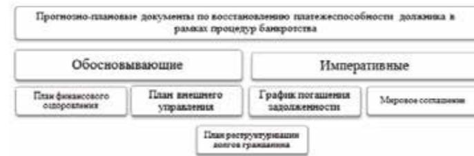
Рис 3. Виды прогнозно-плановых документов в реабилитационных процедурах банкротства

По своему содержанию ПРД относится к планам восстановления платежеспособности должника. В рамках процедур банкротства сформирована система таких планов (рис. 3). Указанные документы можно разделить условно на две группы по критерию наличия обоснования возможности восстановления платежеспособности и соответствующих расчетов с кредиторами: обосновывающие и императивные [Антикризисное управление 2016; Кочетков Е. П., 2015; Трансформация 2014].