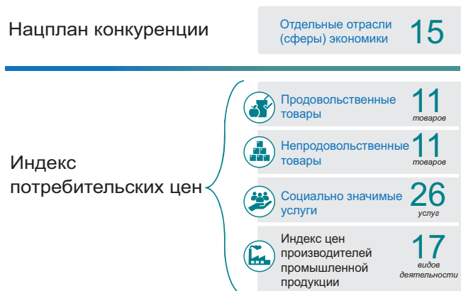
Рис. 2. Описание исходного массива товаров и отраслей для формирования перечня приоритетных товарных рынков Fig. 2. Initial set of products and industries used to define priority product markets