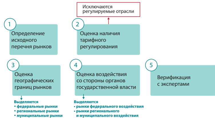
Рис. 1. Описание подхода к определению и классификации приоритетных товарных рынков Fig. 1. Approach to the identification and classification of priority product markets

Определение приоритетных товарных рынков с учетом национальных целей и стратегических задач развития экономики Российской Федерации предлагается осуществить за счет пяти этапов (рис. 1).