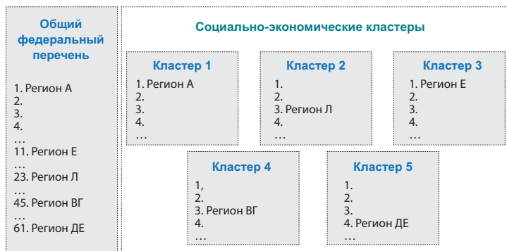
Рис. 3. Представление принципа сравнения уровня развития конкуренции на товарных рынках в регионах на основе кластеров Fig. 3. Cluster-based comparison of competition development level across regional product markets

С целью обеспечения сопоставимого анализа развития конкуренции на приоритетных товарных рынках предлагается осуществить кластерный анализ регионов России в зависимости от ряда макро- и микроэкономических факторов. По состоянию на конец 2024 года Россия, согласно Конституции, состоит из 89 равноправных субъектов. Каждый из этих субъектов характеризуется большим числом социально-экономических показателей, которые определяют уровень развития экономики и общественное благосостояние региона. Задачу анализа конкуренции на некотором региональном рынке методологически более корректно проводить, сопоставляя данный рынок с рынками в регионах, имеющих схожий ряд факторов экономического развития (а не со всеми субъектами РФ). Таким образом, на начальном этапе предлагается решить задачу группировки регионов России по нескольким группам (кластерам), внутри которых предполагается проведение в дальнейшем сравнительного анализа уровня конкуренции на исследуемых товарных рынках (рис. 3).